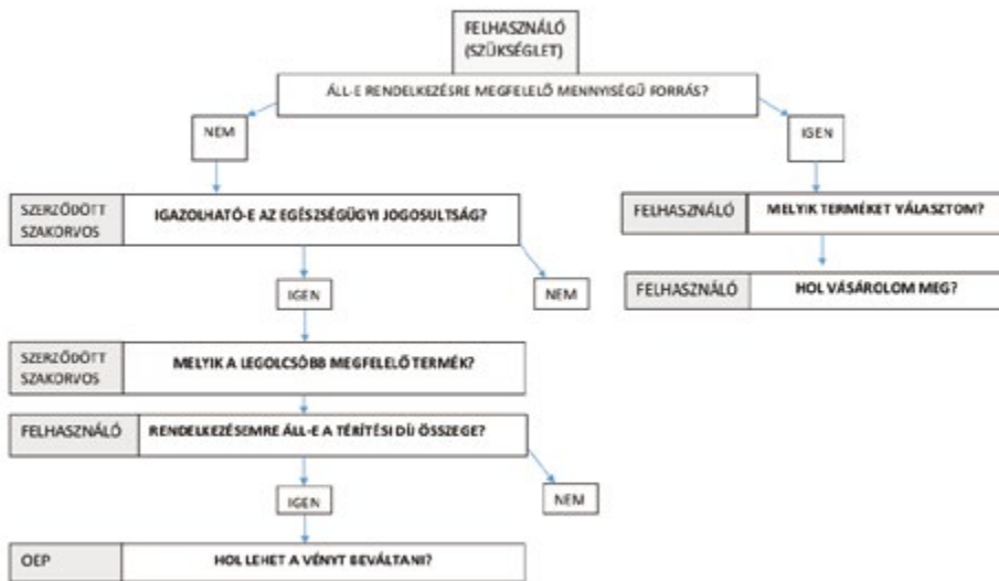
1 ábra: A támogatott és nem támogatott eszközökhöz való hozzáférés

Saját szerkesztés az OEP honlapján, illetve vonatkozó jogszabályokban közölt információk alapján.