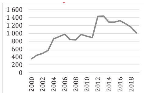
3. ábra Évente otthonteremtési támogatásban részesült fiatal felnőtt (2000–2019)

Továbbra is a KSH intézményi adatgyűjtésére támaszkodva, azt mondhatjuk, hogy 2000 és 2010 között igencsak kevesen jutottak egyáltalán ilyen támogatáshoz, amikor nagykorúvá válva kiléptek az állami gondozás keretei közül. Ezt követően megváltoztak a hozzájutás szabályai is, a statisztikai számbavétel is, mely szerint 2010 után először többen, majd évről évre egyre kevesebben jutnak hozzá ehhez a szerény segítséghez (3. ábra)